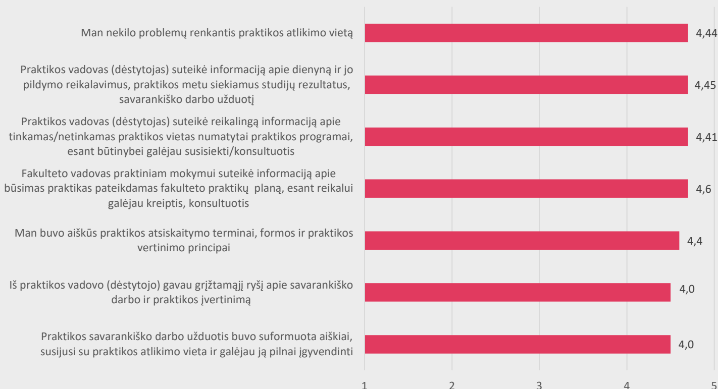
1 pav. Medicinos fakulteto studentų nuomonė apie profesinės veiklos praktikos organizavimą

Apklauso rezultatai: Apklausoje iš viso buvo užpildytos 807 anketos, kurias pildė 2023-2024 m. m. pavasario semestrą praktiką atlikę Medicinos fakulteto studentai (Akušerijos, Bendrosios praktikos slaugos, Burnos higienos, Dantų technologijos, Dietetikos, Ergoterapijos, Kineziterapijos, Kosmetologijos, Odontologinės priežiūros, Radiologijos). Bendrai studentai praktikų organizavimo kokybę vertina labai gerai (9,2 balo). Studentams buvo pateikti teiginiai apie praktikų organizavimą. Atlikus gautų duomenų analizę paaiškėjo, jog didžioji dalis studentų visiškai sutinka su pateiktais teiginiais apie praktikos organizavimą (žr. 1 pav.).