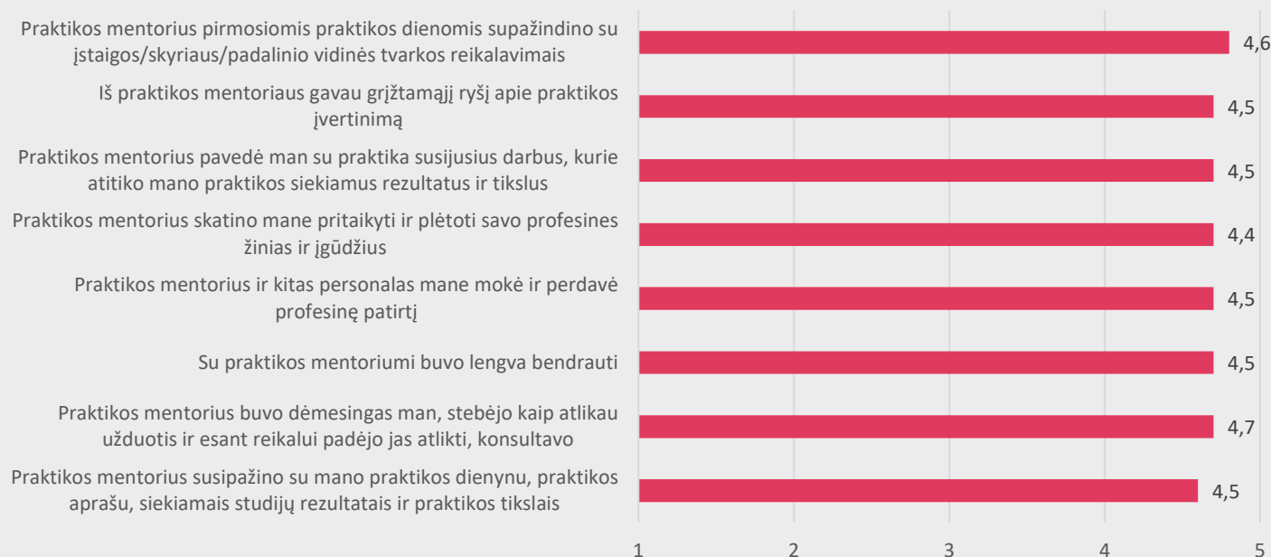
2 pav. Medicinos fakulteto studentų nuomonė apie praktikos mentoriaus vaidmenį praktikos metu

Studentams buvo pateikti teiginiai apie praktikos mentoriaus vaidmenį praktikos metu. Didžioji dalis studentų sutinka su visais pateiktais teiginiais (žr. 2 pav.).