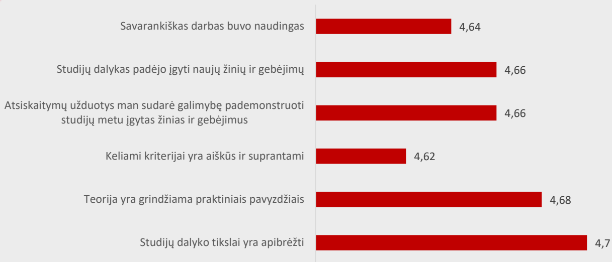
1 pav. Burnos higienos studijų programos dalykų turinio kokybės vertinimas pagal kriterijus (vidurkiai).

Pastaba: Pateiktas „Likerto“ skalės vidurkis.