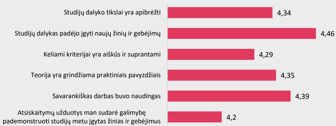
1 pav. Farmakoteknikos studijų programos dalykų turinio kokybės vertinimas pagal kriterijus (vidurkiai).

Pastaba: Pateiktas „Likerto“ skalės vidurkis.