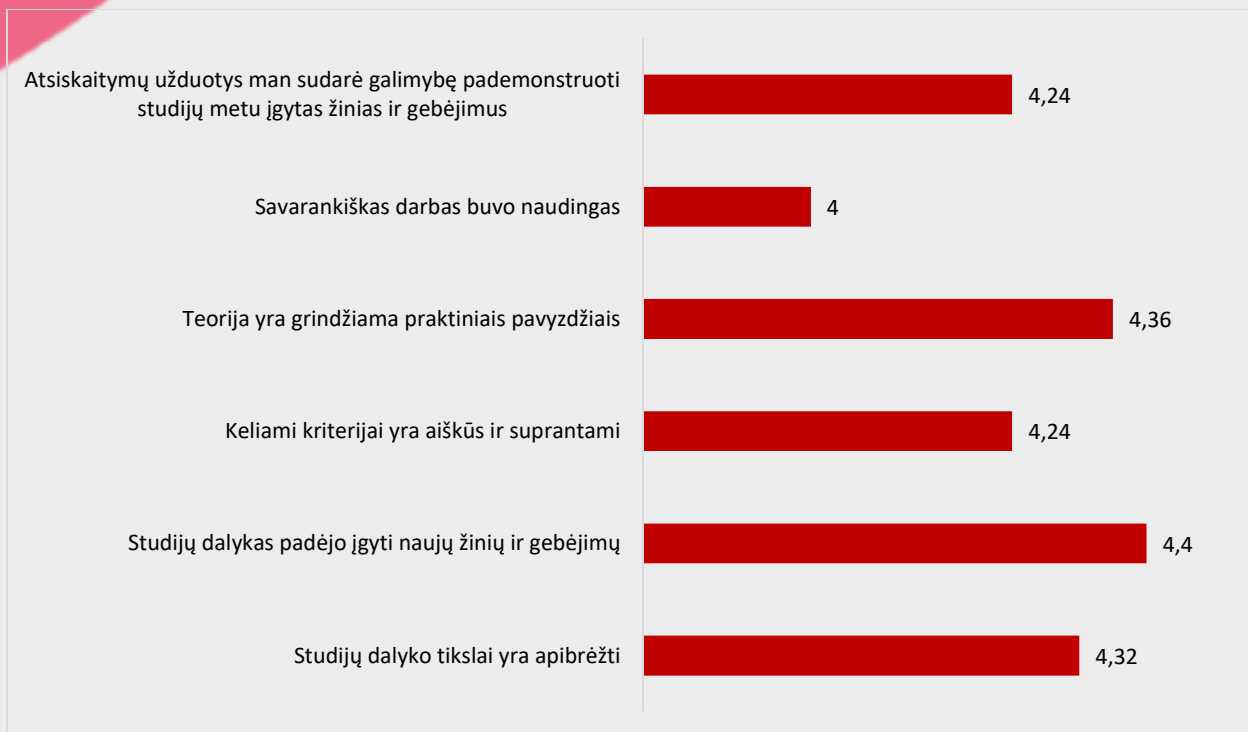
1 pav. Dantų technologijos studijų programos dalykų turinio kokybės vertinimas pagal kriterijus (vidurkiai).

Pastaba: Pateiktas „Likerto“ skalės vidurkis.