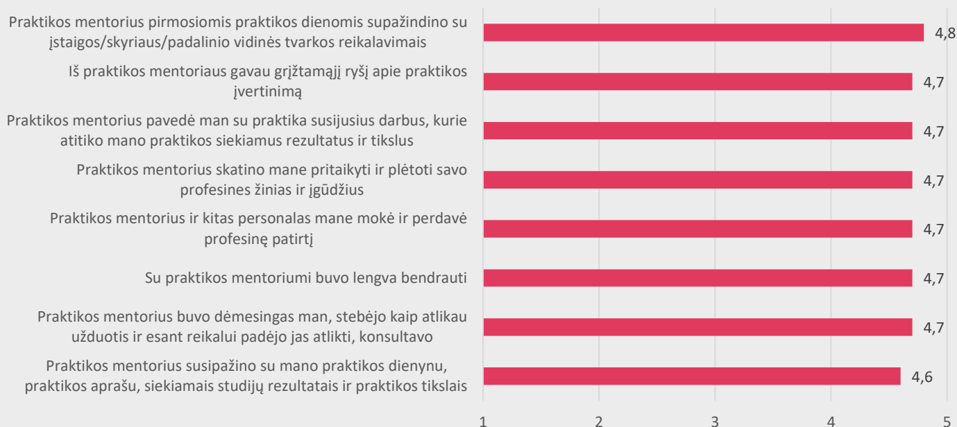
2 pav. Medicinos fakulteto studentų nuomonė apie praktikos mentoriaus vaidmenį praktikos metu

Studentams buvo pateikti teiginiai apie praktikos mentoriaus vaidmenį praktikos metu. Didžioji dalis studentų taip pat visiškai sutinka su visais pateiktais teiginiais (žr. 2 pav.).