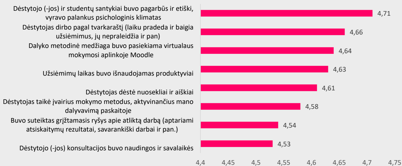
2 pav. Socialinio darbo studijų programos dalykų dėstymo kokybės vertinimas pagal kriterijus (vidurkiai).

Kuo didesnis vidurkis, tuo respondentai labiau sutinka su pateiktu teiginiu