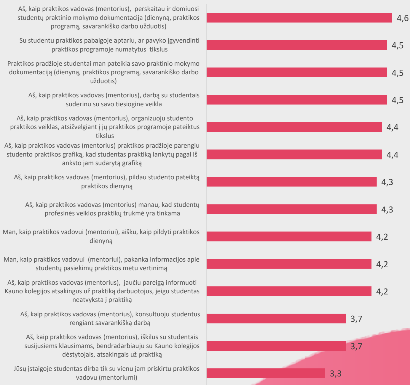
2 pav. Praktikos vadovų (mentorių) nuomonė apie praktikos organizavimą

Praktikos vadovų (mentorių) buvo prašoma įvertinti teiginius, susijusius su praktikos organizavimu. Gautų duomenų analizė atskleidė, jog labiausiai respondentai sutinka su teiginiu, jog jie, kaip praktikos vadovai (mentoriai), perskaito ir domisi studentų praktinio mokymo dokumentacija (Dienynu, praktikos programa, savarankiško darbo užduotimi) (4,6) bei, jog su studentu praktikos pabaigoje aptaria, ar pavyko įgyvendinti praktikos programoje numatytus tikslus (4,5). Mažiausiai respondentai sutinka su teiginiu, jog jie kaip praktikos vadovai (mentoriai) iškilus su studentais susijusiems klausimams bendradarbiauja su Kauno kolegijos dėstytojais atsakingais už praktiką (3,7), bei jog studentas dirba tik su vienu jam priskirtu praktikos vadovu (mentoriumi) 3,3 (žr. 2 pav.).