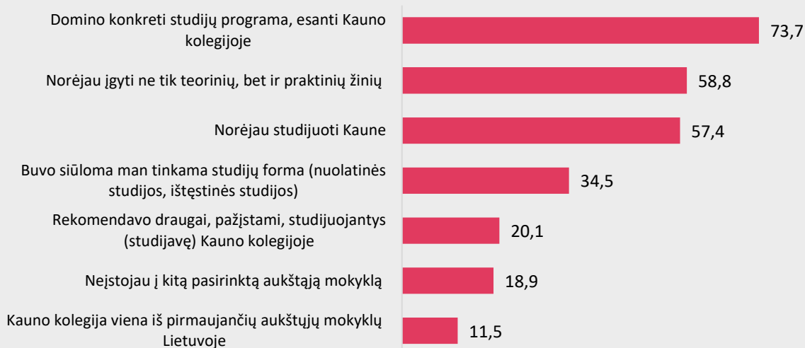
2 pav. I-ojo kurso Medicinos fakulteto studentų Kauno kolegijos, kaip aukštosios mokyklos, pasirinkimo motyvai (proc.)

Trys ketvirtadaliai I-ojo kurso Medicinos fakulteto studentų studijas Kauno kolegijoje pasirinko, nes juos domino konkreti studijų programa (73,7%) ir kiek daugiau nei pusė respondentų atsakė, jog norėjo įgyti ne tik teorinių, bet ir praktinių žinių (58,8) bei, jog norėjo studijuoti Kaune (57,4%) (žr. 2 pav.).