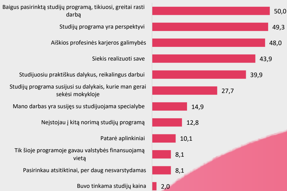
3 pav. I-ojo kurso Medicinos fakulteto studentų, studijų programos, kurioje studijuoja, pasirinkimo motyvai (proc.)

Šiek tiek daugiau nei pusė I-ojo kurso Medicinos fakulteto studentų teigia, jog pasirinko būtent tą studijų programą, kurioje dabar studijuoja, nes baigus studijas, tiki greitai rasti darbą pagal specialybę (50,0%) bei, kad jų nuomone, studijų programa yra perspektyvi (49,3%) (žr. 3 pav.).