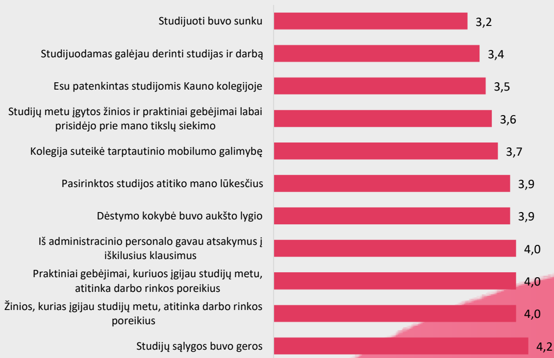
3 pav. Farmakotechnikos studijų programos absolventų nuomonė apie studijas Kauno kolegijoje (proc.) Pastaba: Pakeiktas „Likerto“ skalės vidurkis. Kuo didesnis vidurkis, tuo respondentai labiau sutinka su pateiktu teiginiu

Respondentams buvo pateikti teiginiai apie studijas Kauno kolegijoje ir buvo prašoma įvertinti juos nuo „Labai sutinku“ - 5 iki „Visiškai nesutinku“ – 1. Gautų duomenų analizė atskleidė, jog respondentai labiausiai sutinka su teiginiu, jog studijų sąlygos buvo geros (4,2) mažiausiai respondentai sutinka su teiginiu, jog studijuoti buvo sunku (3,2). (žr. 3 pav.)