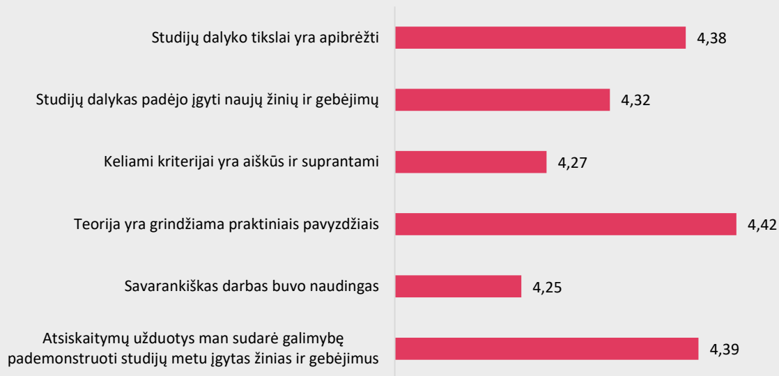
1 pav. Odontologinės priežiūros studijų programos dalykų turinio kokybės vertinimas pagal kriterijus (vidurkiai).

Pastaba: Pateiktas „Likerto“ skalės vidurkis.