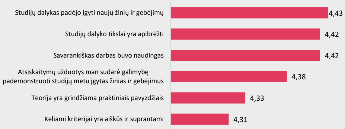
1 pav. Farmakoteknikos studijų programos dalykų turinio kokybės vertinimas pagal kriterijus (vidurkiai).

Pastaba: Pateiktas „Likerto“ skalės vidurkis.