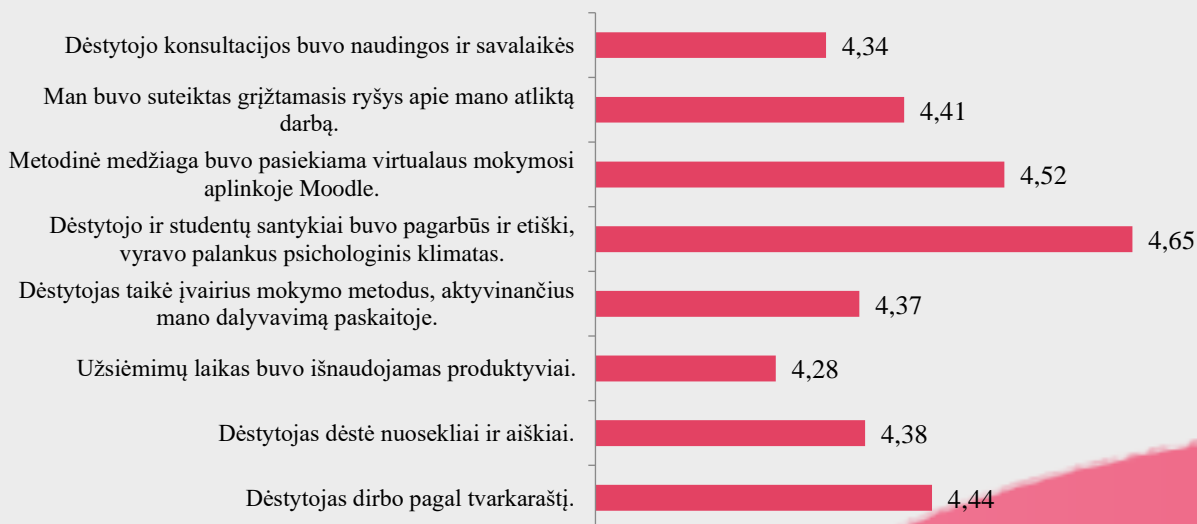
2 pav. Kineziterapijos studijų programos dalykų dėstyto kokybės vertinimas pagal kriterijus (vidurkiai).

Kineziterapijos studijų programos dalykų dėstyto kokybė pagal visus kriterijus vertinama labai aukštai (vidurkiai daugiau nei 4 balai iš 5) (žr. 2 pav.). Respondentai labiausiai sutinka su teiginiais, jog dėstytojo ir studentų santykiai buvo pagarbūs ir etiški, vyravo palankus psichologinis klimatas (4,65) bei, kad metodinė medžiaga buvo pasiekama virtualaus mokymosi aplinkoje Moodle (4,52). Mažiausiai respondentai sutinka su teiginiu, jog užsiėmimų laikas buvo išnaudojamas produktyviai (4,28).