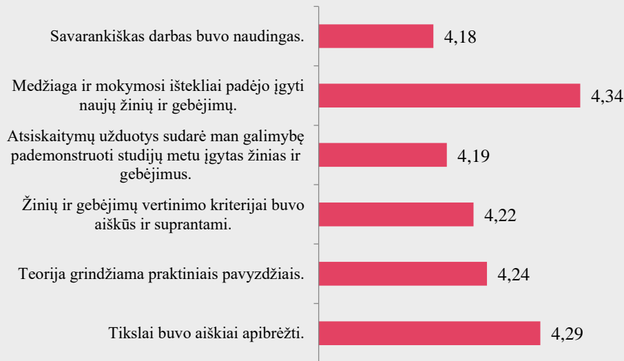
1 pav. Ergoterapijos studijų programos dalykų turinio kokybės vertinimas pagal kriterijus (vidurkiai).

Pastaba: Pateiktas „Likerto“ skalės vidurkis.