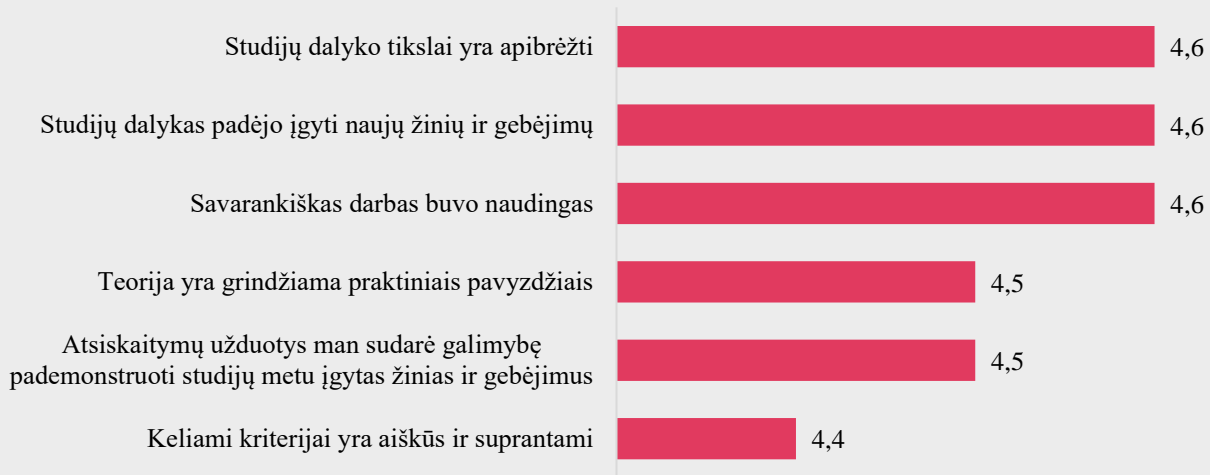
1 pav. Ergoterapijos studijų programos dalykų turinio kokybės vertinimas pagal kriterijus (vidurkiai).

Pastaba: Pateiktas „Likerto“ skalės vidurkis.