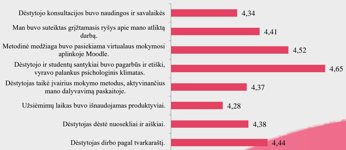
2 pav. Kineziterapijos studijų programos dalykų dėstyto kokybės vertinimas pagal kriterijus (vidurkiai).

Kineziterapijos studijų programos dalykų dėstyto kokybė pagal visus kriterijus vertinama labai aukštai (vidurkiai daugiau nei 4 balai iš 5) (žr. 2 pav.). Respondentai labiausiai sutinka su teiginiais, jog dėstytojo ir studentų santykiai buvo pagarbūs ir etiški, vyravo palankus psichologinis klimatas (4,65) bei, kad metodinė medžiaga buvo pasiekama virtualaus mokymosi aplinkoje Moodle (4,52). Mažiausiai respondentai sutinka su teiginiu, jog užsiėmimų laikas buvo išnaudojamas produktyviai (4,28).