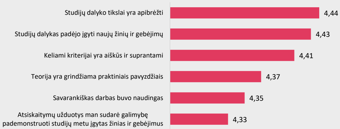
1 pav. Farmakoteknikos studijų programos dalykų turinio kokybės vertinimas pagal kriterijus (vidurkiai).

Pastaba: Pateiktas „Likerto“ skalės vidurkis. Kuo didesnis vidurkis, tuo respondentai labiau sutinka su pateiktu teiginiu