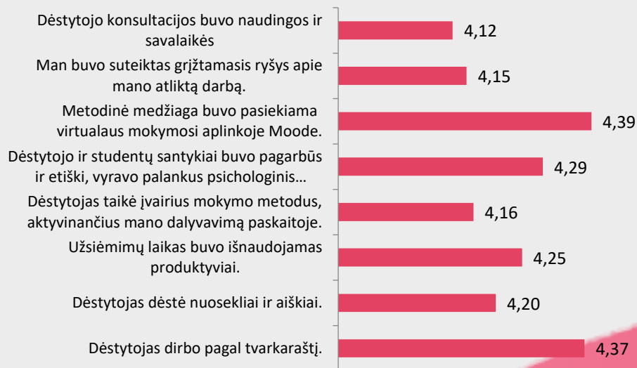
2 pav. Ergoterapijos studijų programos dalykų dėstyto kokybės vertinimas pagal kriterijus (vidurkiai).

Ergoterapijos studijų programos dalykų dėstyto kokybė pagal visus kriterijus vertinama labai aukštai (vidurkiai daugiau nei 4 balai iš 5) (žr. 2 pav.). Respondentai labiausiai sutinka su teiginiais, jog metodinė medžiaga buvo pasiekama virtualioje mokymosi platformoje (4,39) bei, kad dėstytojas dirbo pagal tvarkaraštį (4,37). Mažiausiai respondentai sutinka su teiginiu, jog dėstytojo konsultacijos buvo naudingos ir savalaikės (4,12).