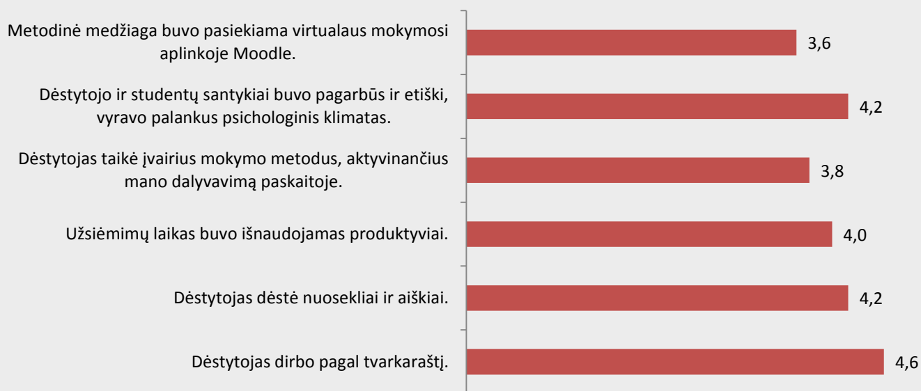
2 pav. Biomedicinos diagnostikos studijų programos dalykų dėstymo kokybės vertinimas pagal kriterijus (vidurkiai).

Biomedicinos diagnostikos studijų programos dalykų dėstymo kokybė pagal visus šešis kriterijus vertinama aukštai (vidurkiai svyruoja nuo 3,6 iki 4,6 iš 5 galimų balų) (žr. 2 pav.).