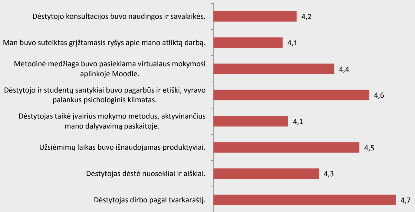
2 pav. Biomedicinos diagnostikos studijų programos dalykų dėstymo kokybės vertinimas pagal kriterijus (vidurkiausiai).

Biomedicinos diagnostikos studijų programos dalykų dėstymo kokybė pagal visus kriterijus vertinama labai aukštai (vidurkiausiai daugiau nei 4 balai iš 5) (žr. 2 pav.).