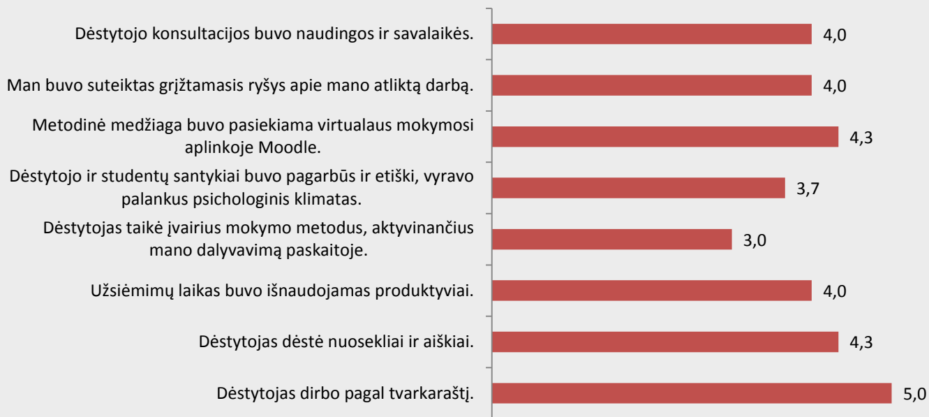
2 pav. Biomedicinos diagnostikos studijų programos dalykų dėstytojų kokybės vertinimas pagal kriterijus (vidurkiai).

Biomedicinos diagnostikos studijų programos dalykų dėstytojų kokybė pagal visus 8 kriterijus vertinama gerai (vidurkiai svyruoja nuo 3 iki 5 balų iš 5) (žr. 2 pav.).