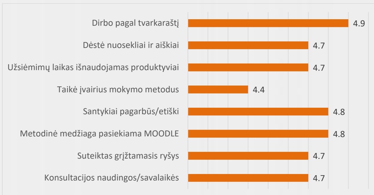
2 pav. Verslo anglų kalbos studijų programos dėstytojų kokybės vertinimas (vidurkiai)

Apklausoje metu studentai turėjo galimybę išreikšti nuomonę, kas labiausiai studijų metu patiko ir ką siūlo tobulinti. Apibendrinti apklausos rezultatų duomenys buvo pateikti posėdžių metu Kalbų centro dėstytojams ir studijų krypties komiteto nariams. Informaciją apie konkrečius dalyko vertinimo rezultatus, teigiamas ir tobulintinas puses dėstytojai gauna studijų valdymo sistemoje.