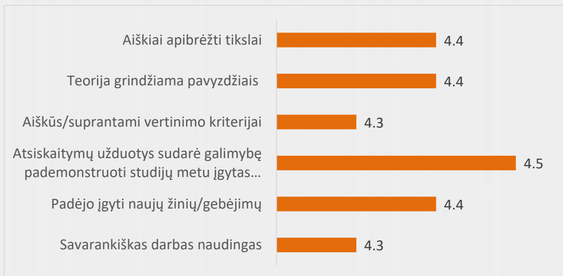
1 pav. Verslo anglų kalbos studijų programos studijų dalykų turinio kokybės vertinimas (vidurkiai)

Apklausoje dalyvavę studentai studijų dalykų turinio kokybę vertina 88 proc. Vertinimo vidurkis pagal visus kriterijus (žr. 1 pav.) nenukrenta žemiau 4.3 balais iš 5, taigi, bendrai studentai dalykų turinio kokybę vertina labai gerai. Aukščiausiai studentai vertino galimybę atsiskaitymų metu pademonstruoti įgytas žinias. Savo pastangas studijuojant studentai vertina 8.9 balais iš 10.