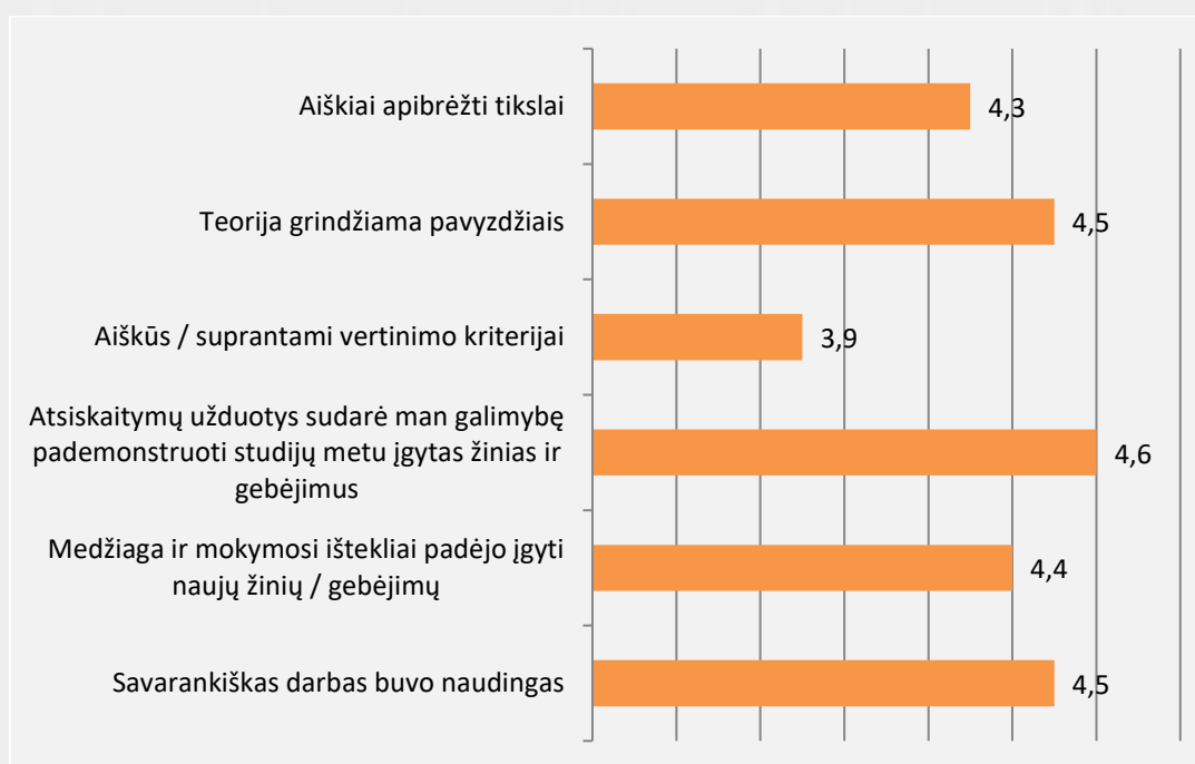
1 pav. Įvaizdžio dizaino studijų programos studijų dalykų turinio kokybės vertinimas (vidurkiai)

Studentai studijų dalykų turinio kokybę vertino 86 proc. Vertinimo vidurkis pagal visus kriterijus (žr. 1 pav.) svyruoja nuo 3,9 iki 4,5 balo. Bendrai studentai dalykų turinio kokybę vertino gerai. Aukščiausiai studentai vertino tai, kad atsiskaitymų užduotys sudarė galimybes pademonstruoti studijų metu įgytas žinias ir gebėjimus. Savo įdėtas pastangas studijuojant studentai vertino 8,8 balais iš 10.