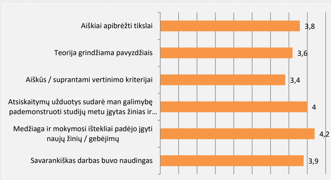
1 pav. Dailės kūrinių konservavimo ir restauravimo studijų programos studijų dalykų turinio kokybės vertinimas (vidurkiai)

Studentai studijų dalykų turinio kokybę vertino 65 proc. Vertinimo vidurkis pagal visus kriterijus (žr. 1 pav.) svyruoja nuo 3,4 iki 4,2 balų. Bendrai studentai dalykų turinio kokybę vertino gerai. Aukščiausiai studentai vertino tai, kad pateikta medžiaga ir mokymosi išteklių padėjo įgyti naujų žinių / gebėjimų bei atsiskaitymų užduotys sudarė galimybę pademonstruoti studijų metu įgytas žinias ir gebėjimus. Savo įdėtas pastangas studijuojant studentai vertino 9,6 balais iš 10.