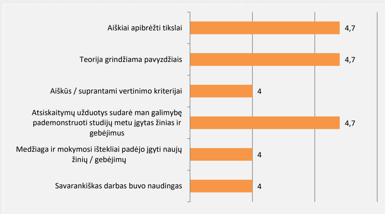
1 pav. Stiklo, keramikos, odos, tekstilės menas studijų programos studijų dalykų turinio kokybės vertinimas (vidurkiai)

Studentai studijų dalykų turinio kokybę vertino 87 proc. Vertinimo vidurkis pagal visus kriterijus (žr. 1 pav.) labai aukštas ir svyruoja nuo 4 iki 4,7 balų. Bendrai studentai dalykų turinio kokybę vertino labai gerai. Pagal visus pateiktus kriterijus studentai geriausiai vertino tai, kad aiškiai apibrėžti tikslai, teorija grindžiama praktika, atsiskaitymų užduotys sudarė galimybę pademonstruoti studijų metu įgytas žinias ir gebėjimus. Savo įdėtas pastangas studijuojant studentai vertino 8,7 balais iš 10.