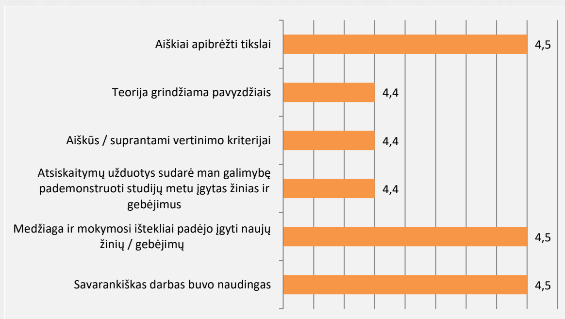
1 pav. Ikimokyklinio ir priešmokyklinio ugdymo studijų programos studijų dalykų turinio kokybės vertinimas (vidurkiai)

Studentai studijų dalykų turinio kokybę vertino 91 proc. Vertinimo vidurkis pagal visus kriterijus (žr. 1 pav.) svyruoja nuo 4,4 iki 4,5 balų. Bendrai studentai dalykų turinio kokybę vertino labai gerai. Aukščiausiai studentai vertino tai, kad aiškiai apibrėžti tikslai, medžiaga ir mokymosi išteklių padėjo įgyti naujų žinių ir gebėjimų, savarankiškas darbas buvo naudingas. Savo įdėtas pastangas studijuojant studentai vertino 9,2 balais iš 10.