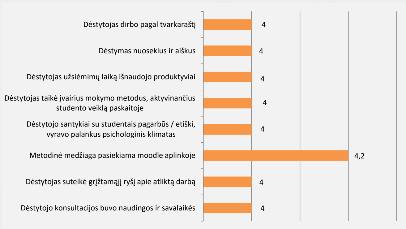
2 pav. Stiklo, keramikos, odos, tekstilės menas studijų programos dėstytojų kokybės vertinimas (vidurkiai)

Studentai dėstytojų kokybę vertino 75 proc. Vertinimo vidurkis pagal visus kriterijus aukštas (žr. 2 pav.) nuo 4 iki 4,2 balo. Bendrai studentai dalykų dėstytojų kokybę vertino labai gerai. Aukščiausiai studentai vertino tai, kad metodinė medžiaga pasiekama moodle aplinkoje.