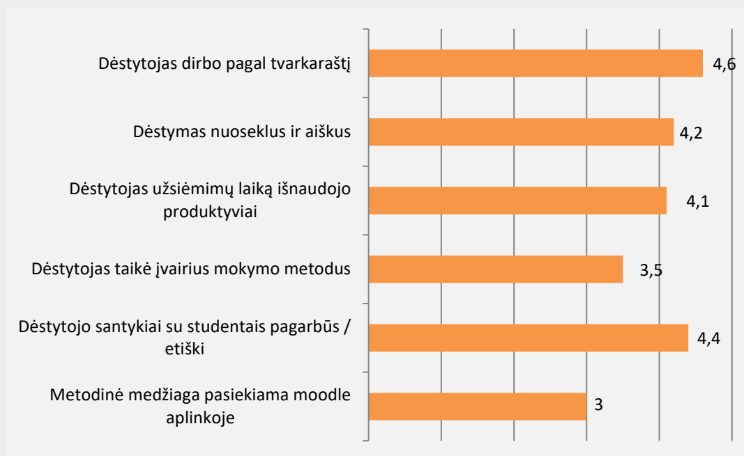
2 pav. Dizaino studijų programos dėstytojų kokybės vertinimas (vidurkiai)

Studentai dėstytojų kokybę vertino 81,9 proc. Vertinimo vidurkis pagal visus kriterijus (žr. 2 pav.) nuo 3 iki 4,6 balo. Bendrai studentai dalykų dėstytojų kokybę vertino gerai. Aukščiausiai studentai vertino tai, kad dėstytojai dirbo pagal tvarkaraštį ir pagarbiai / etiškai elgėsi su studentais. Žemiausiai vertintas metodinės medžiagos pasiekimas moodle aplinkoje.