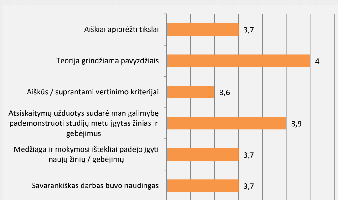
1 pav. Dizaino studijų programos studijų dalykų turinio kokybės vertinimas (vidurkiai)

Studentai studijų dalykų turinio kokybę vertino 75,8 proc. Vertinimo vidurkis pagal visus kriterijus (žr. 1 pav.) svyruoja nuo 3,6 iki 4 balų. Bendrai studentai dalykų turinio kokybę vertino gerai. Aukščiausiai studentai vertino tai, kad teorija grindžiama pavyzdžiais ir, kad atsiskaitymų užduotys sudarė galimybę pademonstruoti studijų metu įgytas žinias ir gebėjimus. Savo įdėtas pastangas studijuojant studentai vertino 8,3 balais iš 10.