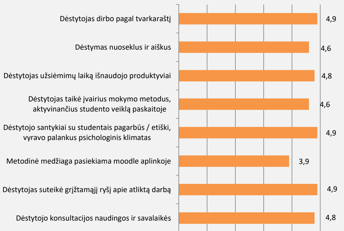
2 pav. Stiklo, keramikos, odos, tekstilės menas studijų programos dėstytojų kokybės vertinimas (vidurkiai)

Studentai dėstytojų kokybę vertino 94 proc. Vertinimo vidurkis pagal visus kriterijus (žr. 2 pav.) nuo 3,9 iki 4,9 balo. Bendrai studentai dalykų dėstytojų kokybę vertino labai gerai. Aukščiausiai studentai vertino tai, kad dėstytojai dirbo pagal tvarkaraštį, suteikė studentui grįžtamąjį ryšį apie atliktą darbą bei dėstytojo santykiai su studentais buvo pagarbūs / etiški, vyravo palankus psichologinis klimatas.