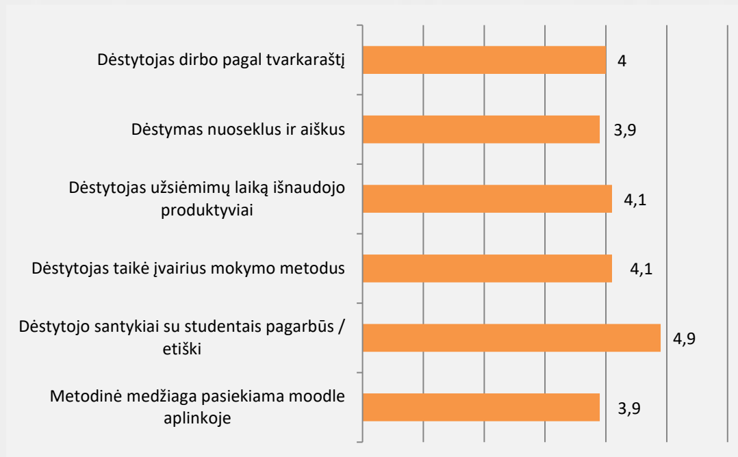
2 pav. Fotografijos studijų programos dėstytojų kokybės vertinimas (vidurkia)

Studentai dėstytojų kokybę vertino 62,8 proc. Vertinimo vidurkis pagal visus kriterijus (žr. 2 pav.) nuo 3,9 iki 4,9 balo. Bendrai studentai dalykų dėstytojų kokybę vertino gerai. Aukščiausiai studentai vertino tai, kad dėstytojai bendraudami su studentais išlaikė pagarbius ir etiškus santykius, dėstytojai paskaitų laiką išnaudojo produktyviai bei taikė įvairius mokymo metodus.