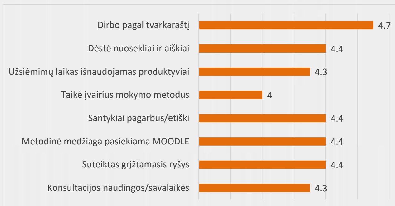
2 pav. Anglų kalbos ryšiams su visuomene studijų programos dėstytojų kokybės vertinimas (vidurkiai)

Studentai dėstytojų kokybę vertina 89.8 proc. Vertinimo vidurkis pagal visus kriterijus (žr. 2 pav.) nenukrenta žemiau 4 balų iš 5, taigi, bendrai studentai dalykų dėstytojų kokybę vertina gerai. Aukščiausiai studentai vertino darbą, atitinkantį tvarkaraštį. Taip pat labai gerai studentai vertino pagarbius ir etiškus santykius su dėstytojais, nuoseklių ir aiškių dėstytojų stilių, suteikiamą grįžtamąjį ryšį ir metodinės medžiagos prieinamumą MOODLE.