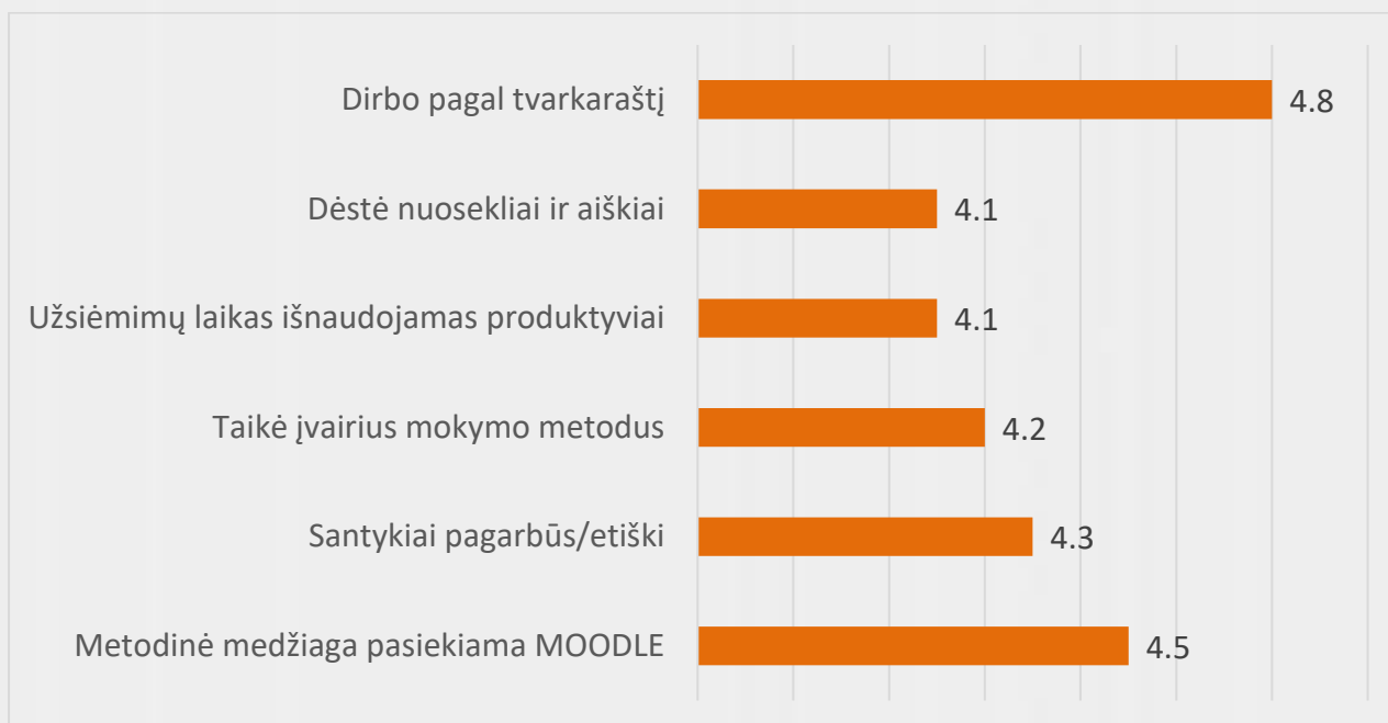
2 pav. Anglų kalbos ryšiams su visuomene studijų programos dėstymo kokybės vertinimas (vidurkiai)

Apklausoje metu studentai turėjo galimybę išreikšti nuomonę, kas labiausiai studijų metu patiko ir ką siūlo tobulinti. Apibendrinti apklausos rezultatų duomenys, teigiamos ir tobulintinos pusės buvo aptartos Kalbų centro posėdžio metu, individualiai aptarti su dėstytojais.