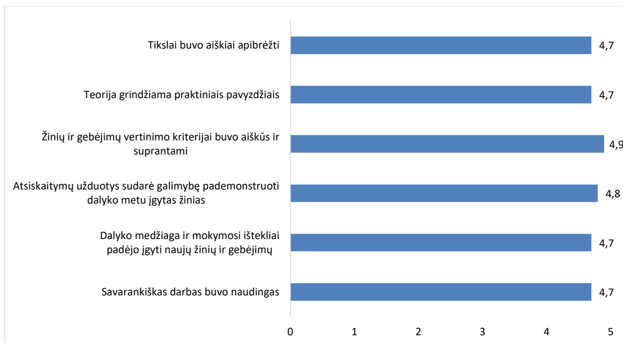
1 pav. Studijų programos Baldų gamybos technologijos dalykų turinio kokybės vertinimas (aritmetinis vidurkis)

Apibendrinus rezultatus Baldų gamybos technologijų studijų programos dalykų turinio kokybės vertinimo vidurkis yra 4,8 balai iš 5 (žr. 1 pav.). Visus išskirtus kriterijus studentai vertino labai panašiai.