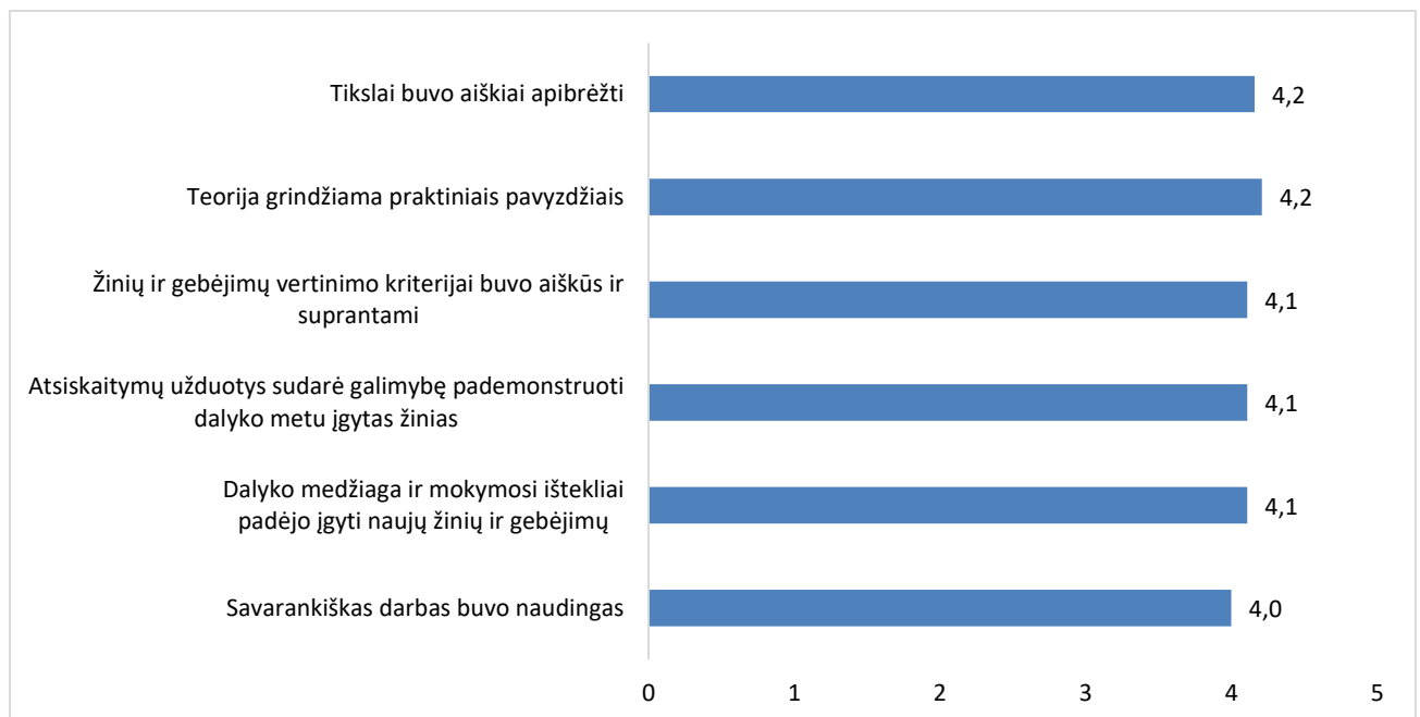
1 pav. Studijų programos Automatika ir robotika dalykų turinio kokybės vertinimas (aritmetinis vidurkis)

Studijų programos Automatika ir robotika dalykų turinio kokybės įvertinimo vidurkis yra 4,1 balo (žr. 1 pav.). Dalykų turinio kokybės vertinimas pagal atskirus kriterijus yra labai panašus.