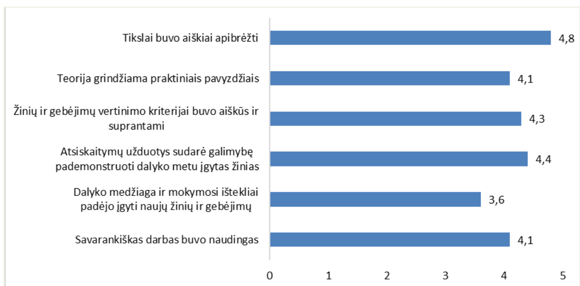
1 pav. Studijų programos Skaitmeninė elektronika dalykų turinio kokybės vertinimas (aritmetinis vidurkis)

Studijų programos Skaitmeninė elektronika dalykų turinio kokybės įvertinimo vidurkis yra 4,2 balo (žr. 1 pav.). 2020–2021 m. m. pavasario semestru šis įvertinimas buvo lygus 4,3 balo.