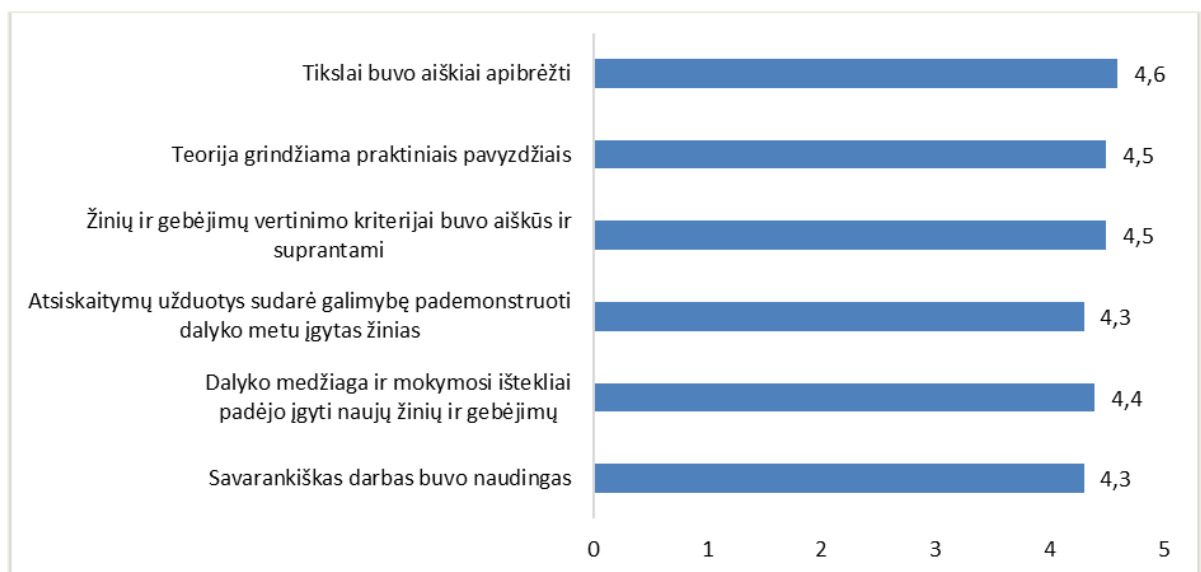
1 pav. Studijų programos Pramoninio dizaino inžinerija dalykų turinio kokybės vertinimas (aritmetinis vidurkis)

Studijų programos Pramoninio dizaino inžinerija dalykų turinio kokybės vertinimo vidurkis yra 4,4 balo (žr. 1 pav.), t. y. toks pat kaip ir 2020–2021 m. m. pavasario semestre.