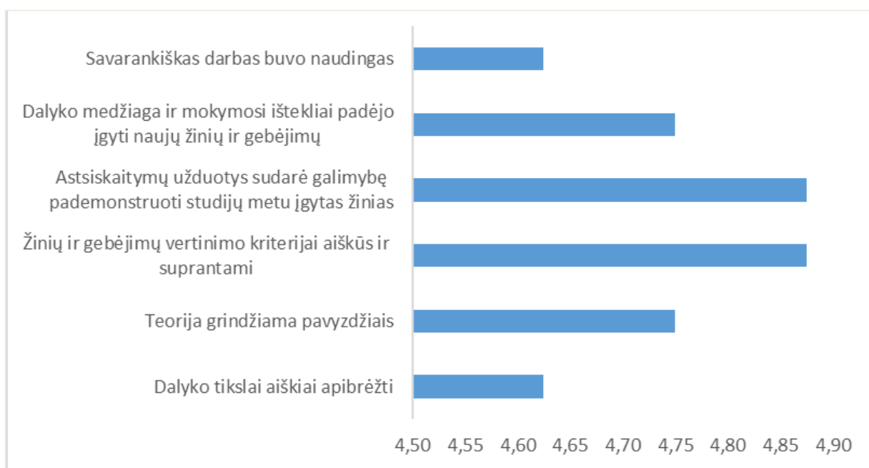
3 pav. Studijų programos Maisto sauga ir kokybė dalykų turinio kokybės vertinimas pagal šešis kriterijus (aritmetinis vidurkis)

Studijų programos Maisto sauga ir kokybė dalykų turinio kokybės įvertinimų vidurkis yra 4,75 balo (žr. 3 pav.). 2020–2021 m. m. pavasario semestre studijų dalykų turinio įvertinimų vidurkis buvo 4,63 balo.