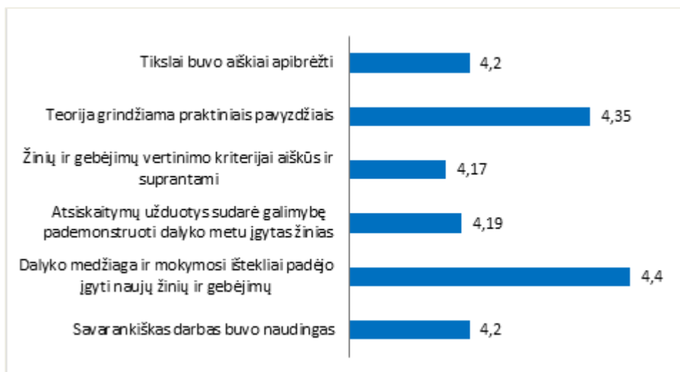
1 pav. Studijų programos Multimedijos technologija dalykų turinio kokybės vertinimas pagal šešis kriterijus (aritmetinis vidurkis)

Studijų programos Multimedijos technologija dalykų turinio kokybės įvertinimų vidurkis yra 4,25 balo (žr. 1 pav.). 2020–2021 m. m. pavasario semestro studijų dalykų turinio įvertinimų vidurkis buvo 4,32 balo.