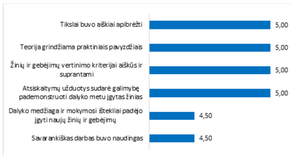
1 pav. Studijų programos Grafinės ir skaitmeninės medijos dalykų turinio kokybės vertinimas pagal šešis kriterijus (aritmetinis vidurkis)

Studijų programos Grafinės ir skaitmeninės medijos dalykų turinio kokybės įvertinimų vidurkis yra 4,83 balo (žr. 1 pav.). 2020–2021 m. m. pavasario semestro studijų dalykų turinio įvertinimų vidurkis buvo 4,70 balo.