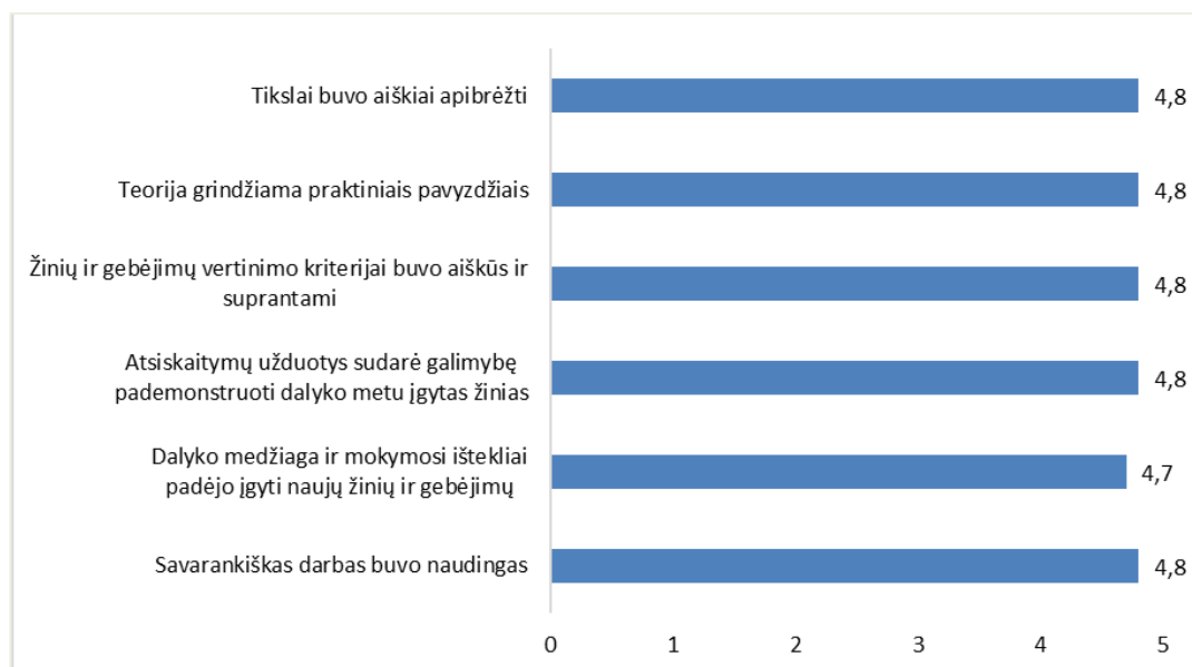
1 pav. Studijų programos Baldų gamybos technologijos dalykų turinio kokybės vertinimas (aritmetinis vidurkis)

Studijų programos Baldų gamybos technologijos dalykų turinio kokybės įvertinimo vidurkis yra lygus 4,8 balo (žr. 1 pav.).