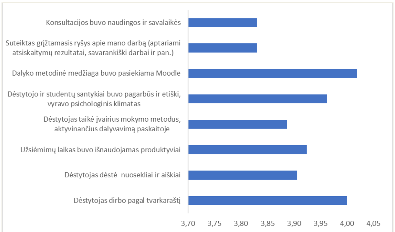
2 pav. Studijų programos Agroverslų technologijos dalykų dėstyto kokybės vertinimas pagal aštuonis kriterijus (aritmetinis vidurkis)

Studijų programos Agroverslų technologijos dalykų dėstyto kokybės įvertinimų vidurkis yra 3,92 balo (žr. 2 pav.).