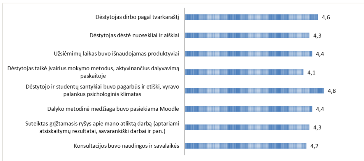
2 pav. Studijų programos Pramoninio dizaino inžinerija dalykų dėstytojų kokybės vertinimas pagal kriterijus (vidurkiai)

Nagrinėjamos studijų programos dalykų dėstytojų kokybės vertinimo pagal visus kriterijus vidurkis yra 4,4 balai iš 5 (žr. 2 pav.). 2020–2021 m. m. rudens semestro studijų dalykų dėstytojų įvertinimų vidurkis buvo 4,2 balo.