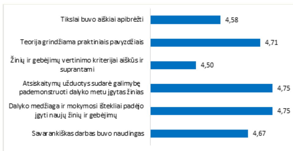
1 pav. Studijų programos Reklamos technologijos dalykų turinio kokybės vertinimas pagal šešis kriterijus (vidurkiai)

Studijų programos Reklamos technologijos dalykų turinio kokybės įvertinimų vidurkis yra 4,66 balo (žr. 1 pav.). 2020–2021 m. m. rudens semestro studijų dalykų turinio įvertinimų vidurkis buvo 4,5 balo.