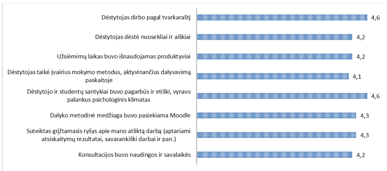
2 pav. Pramoninio dizaino inžinerijos studijų programos dalykų dėstytojų kokybės vertinimas (vidurkia)

Pramoninio dizaino inžinerijos studijų programos dalykų dėstytojų kokybės įvertinimų vidurkis yra 4,3 balo (žr. 2 pav.).