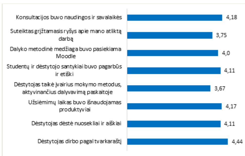
2 pav. Studijų programos Reklamos technologijos dalykų dėstyto kokybės vertinimas pagal aštuonis kriterijus (vidurkiai)

Studijų programos Reklamos technologijos dalykų dėstyto kokybės įvertinimų vidurkis yra 4,1 balo (žr. 2 pav.).