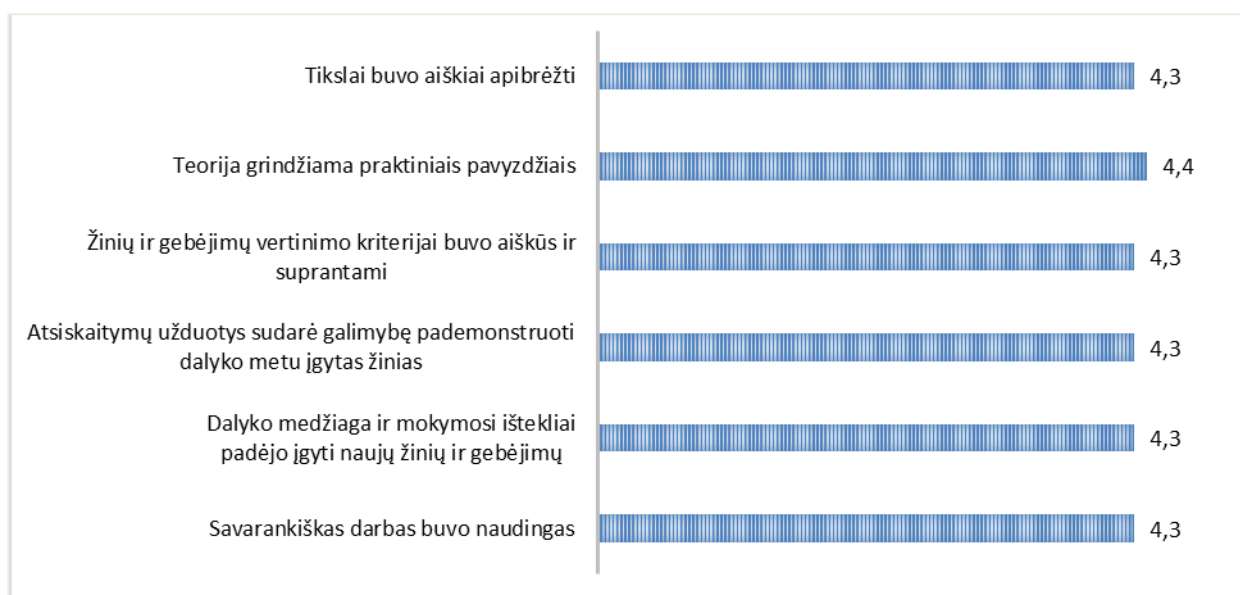
1 pav. Išmaniųjų sistemų studijų programos dalykų turinio kokybės vertinimas (vidurkiai)

Išmaniųjų sistemų studijų programos dalykų turinio kokybės įvertinimų vidurkis yra 4,3 balo (žr. 1 pav.).