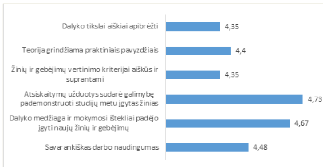
1 pav. Studijų programos Reklamos technologija dalykų turinio kokybės vertinimas pagal šešis kriterijus (vidurkiai)

Studijų programos Reklamos technologija dalykų turinio kokybės įvertinimų vidurkis yra 4,5 balo (žr. 1 pav.).