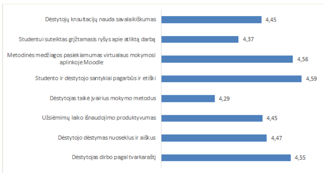
3 pav. Maisto technologija studijų programos dalykų dėstymo kokybės vertinimas (vidurkiai)

Studijų programos Maisto technologija dalykų dėstymo kokybė vertinama labai gerai (įvertinimų vidurkis yra 4,46 balo) (žr. 3 pav.).