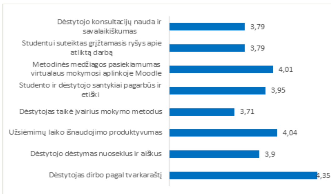
2 pav. Studijų programos Multimedijos technologija dalykų dėstyto kokybės vertinimas pagal aštuonis kriterijus (vidurkiai)

Studijų programos Grafinės ir skaitmeninės medijos dalykų dėstyto kokybės įvertinimų vidurkis yra 4,37 balo (žr. 2 pav.).